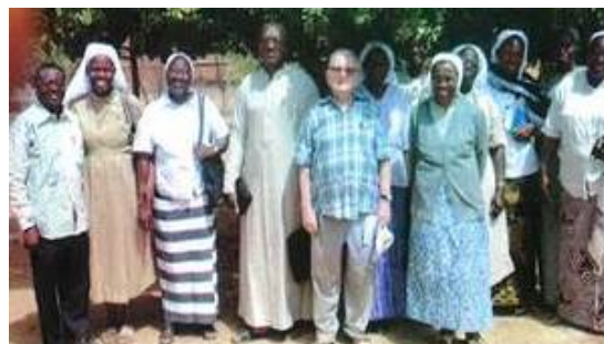
Voluntàries i voluntaris del centre "Paam Yôodo"