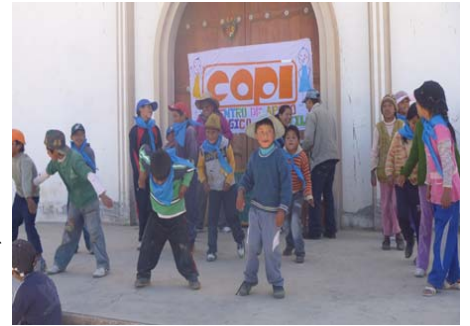
Nens del Centre de Suport Pedagògic d'El Alto