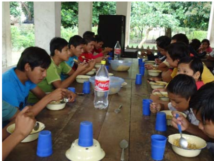
Esmorzant a l'internat de San Francisco de Moxos