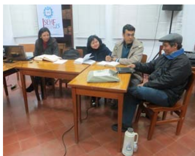
L'equip de traductors del Missal al guaraní