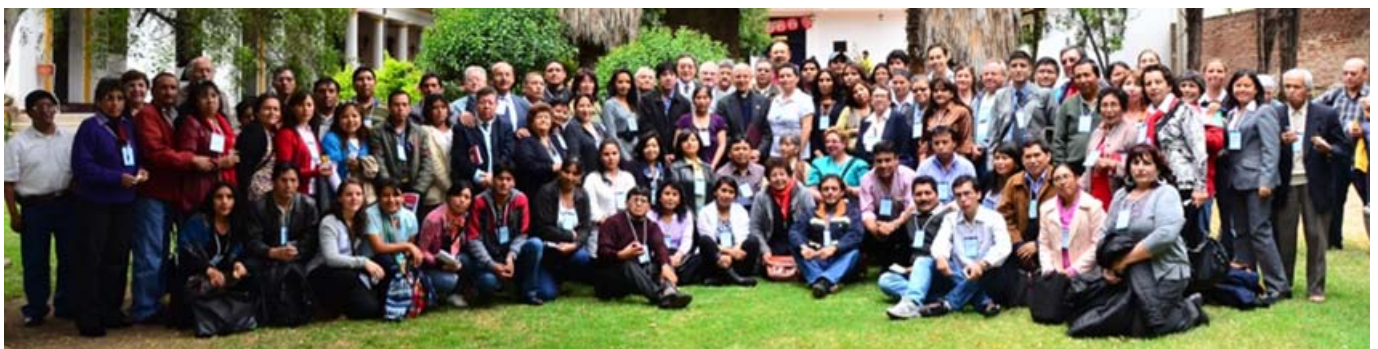
Trobada dels equips interculturals, l'any 2012, amb el P. Adolfo Nicolás SJ, General de la Companyia de Jesús