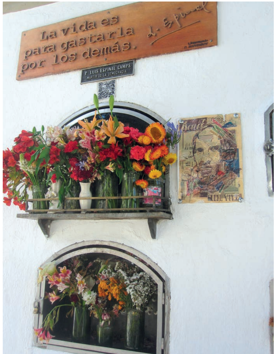
A la seva tomba sempre hi ha flors fresques.