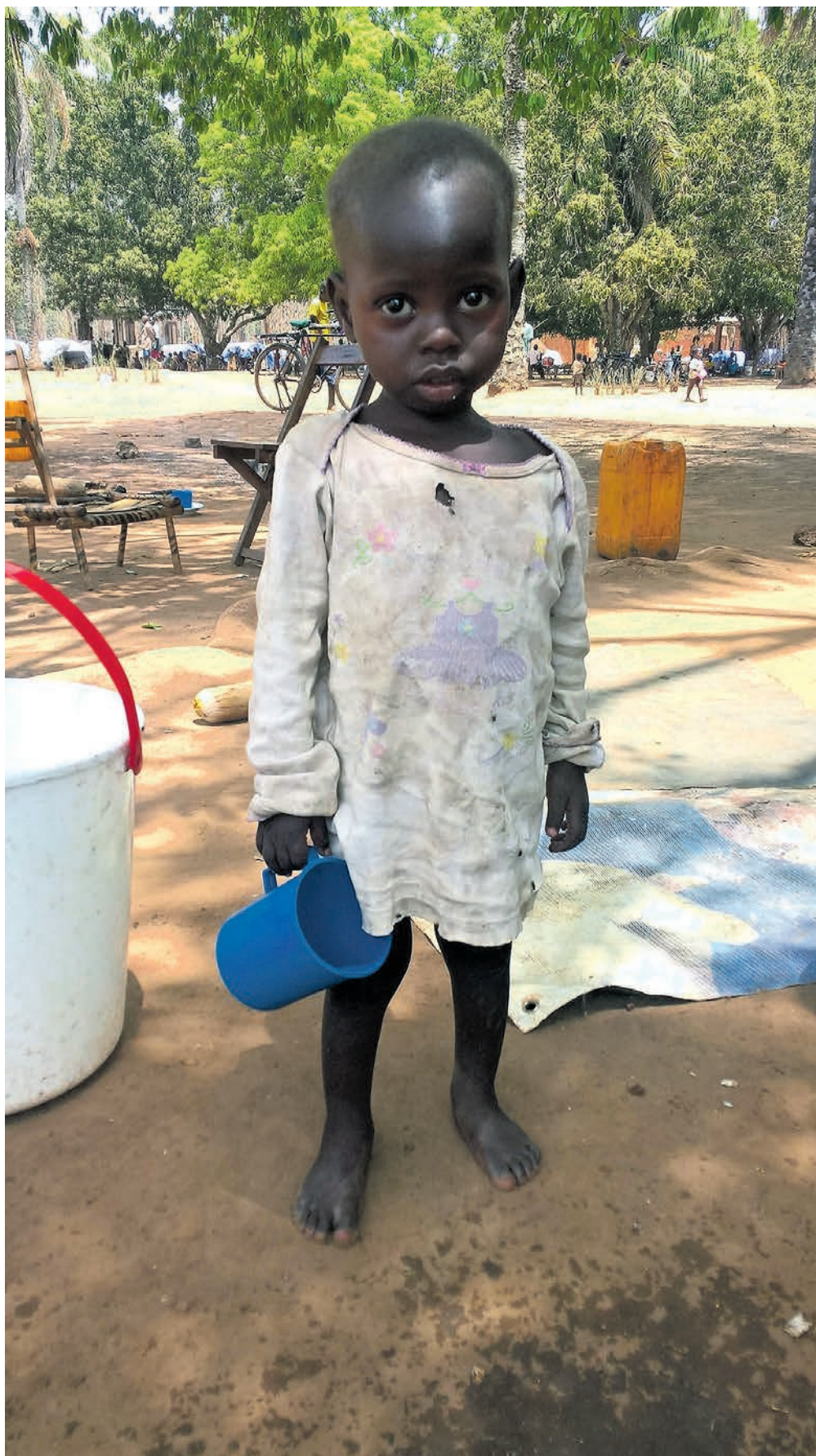
Un milió d'infants pateix malnutrició aguda.