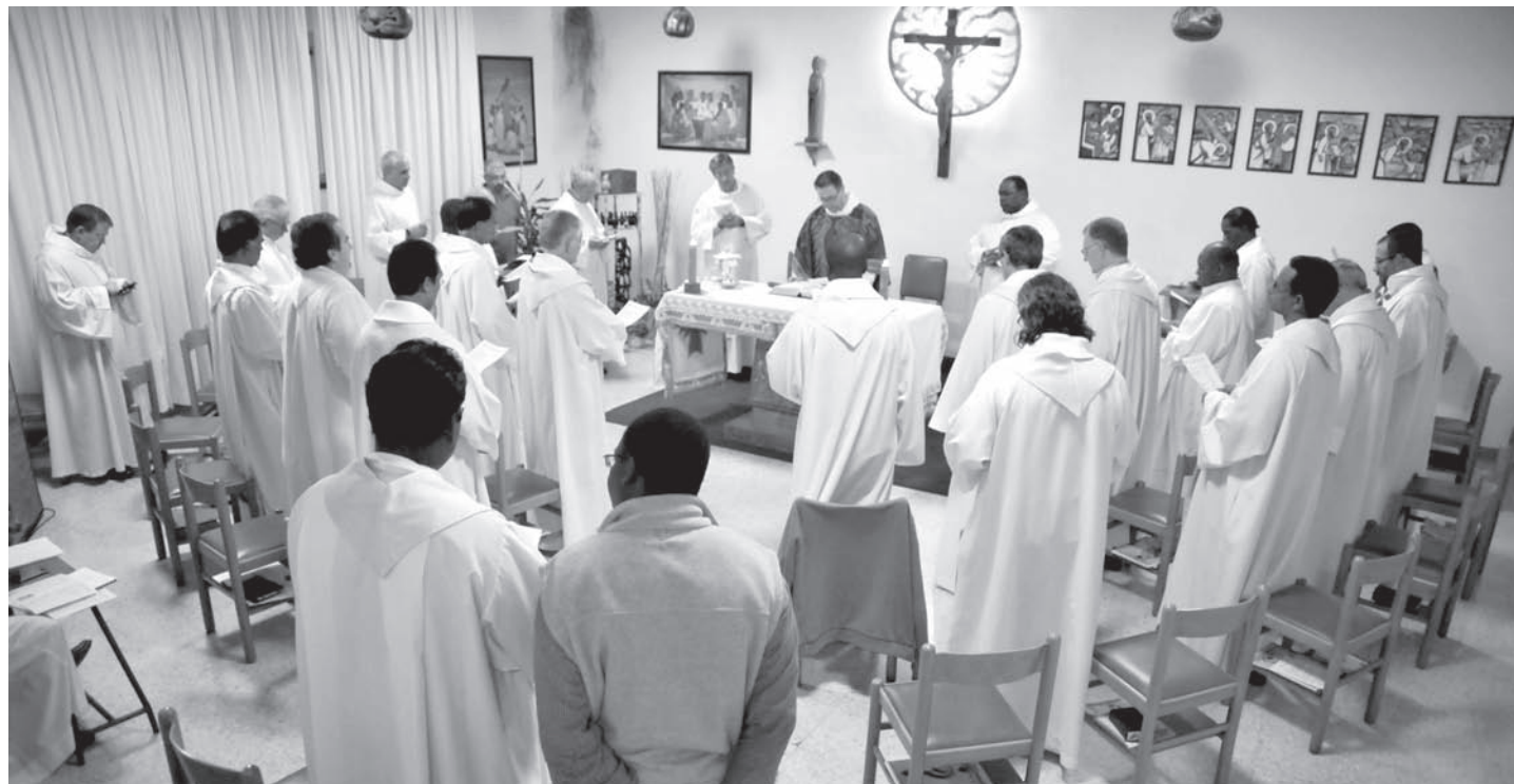
XXVII Capítol General de la Congregació Salesiana, celebrat del 3 març al 12 d'abril.

Pel que fa a l'organització territorial, la nova província compta amb Plataformes Apostòliques Locals (PAL), que agrupen les diverses activitats o institucions de la Companyia de Jesús d'una zona concreta que treballen sota la coordinació i animació d'un