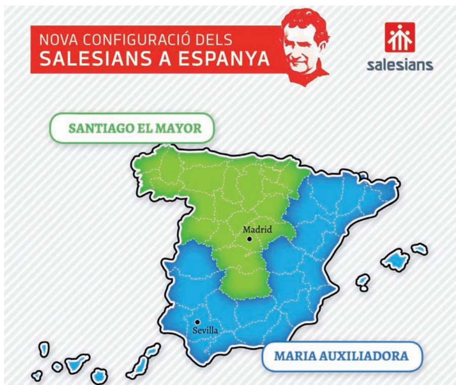
Províncies salesianes a Espanya.