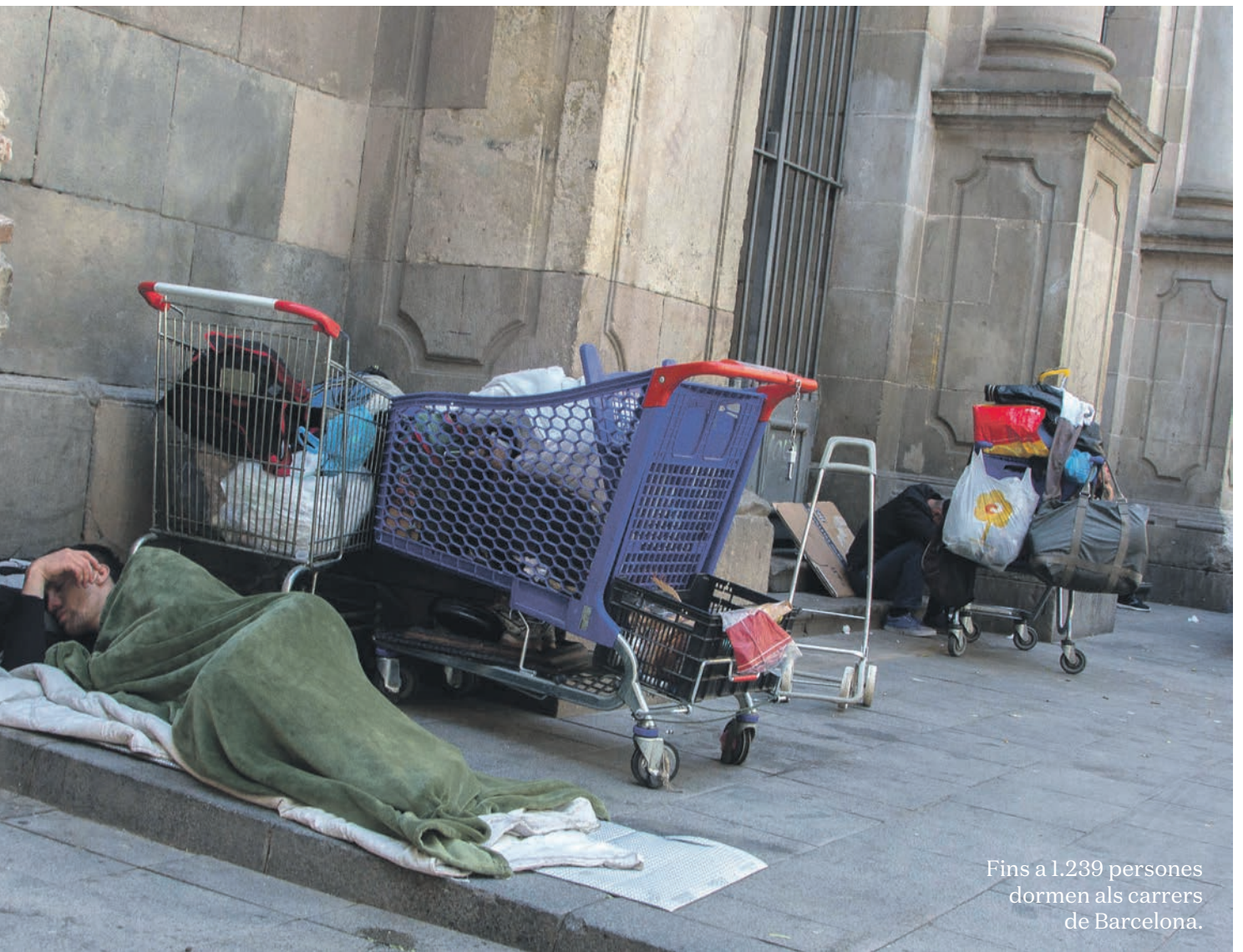
Fins a 1.239 persones dormen als carrers de Barcelona.