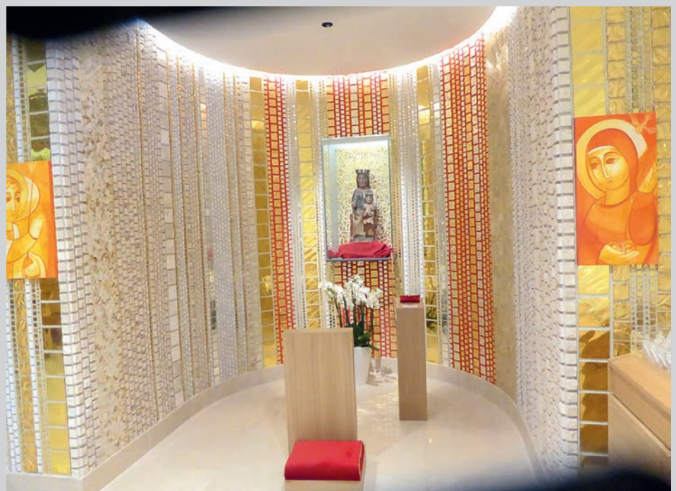
Capella de la Mare de Déu de Canòlich.

En el centre de la decoració hi ha la tradicional figura del Pantocràtor, i se li afegeixen sant Germà i sant Julià, patrons del municipi