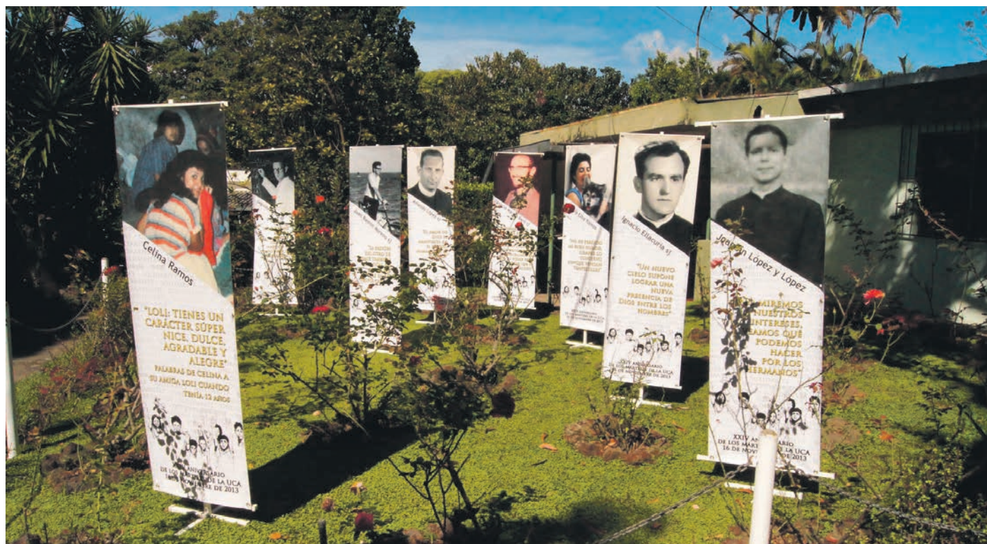
Rosers en record dels màrtirs al jardí on van ser assassinats.

Per elaborar el que li ha estat explicat de viva veu, l'autor retalla, afegeix, edita i posa en llenguatge literari entrevistes i diàlegs que ha dut a terme, sense traïr les veus, perquè fa