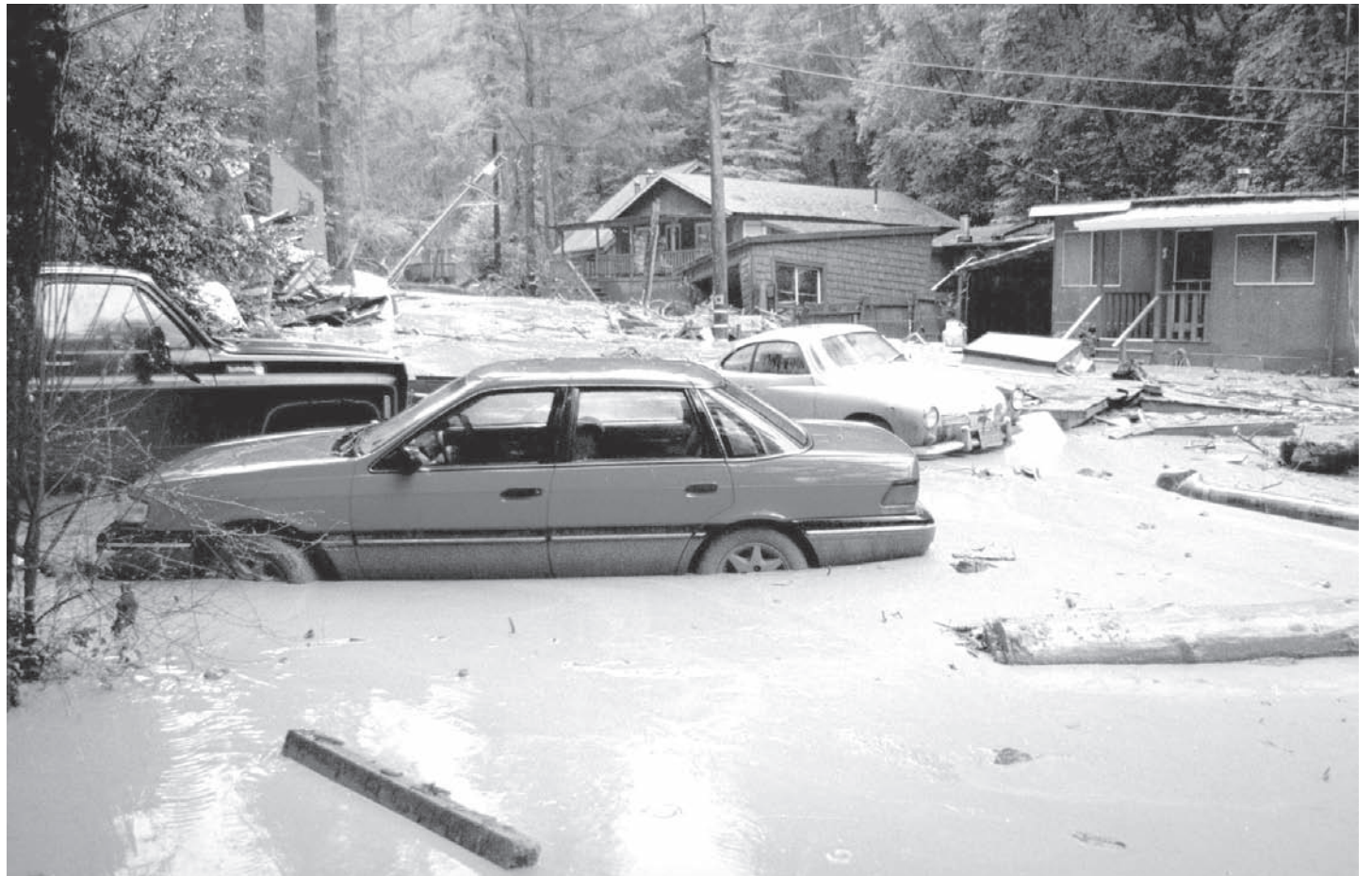
Danys de les tempestes el 1998 causades pel «Niño» del 1997 a Califòrnia.

Ja sabem que sempre té importants conseqüències climàtiques i ecològiques, perquè origina pluges diluvianes a l'Est del Pacífic i elevada mortalitat marina (i fins i tot també terrestre) amb la corresponent minva de producció pesquera. Hi ha anys que més i anys que no tant, és clar, però sembla que aquest serà un any dels de més. No es pot dir amb certesa, però ens ho adverteixen els experts. El Niño més dramàtic dels últims anys va ser el 1983, que va arribar a alterar el clima de moltes parts del món: hivern intens al Nord que, entre altres coses, produí pluges importants a Califòrnia i nevades rècord a les muntanyes Rocalloses, mentre que a l'Índia,