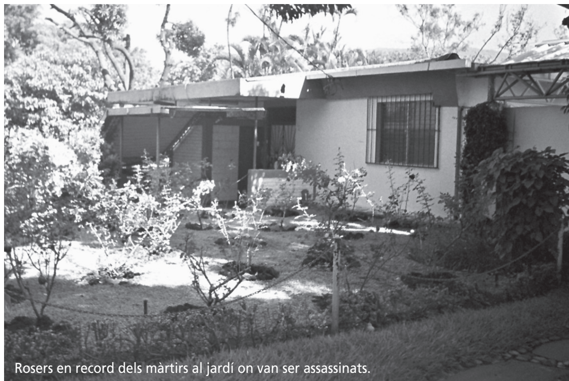
Rosers en record dels màrtirs al jardí on van ser assassinats.

Ellacuría va ser un gran col·laborador de monsenyor Oscar Romero. Va ser un mestre que el va ajudar a llegir la realitat amb uns altres ulls, a comprendre i a estimar profundament el poble salvadorenc i que li va donar força per