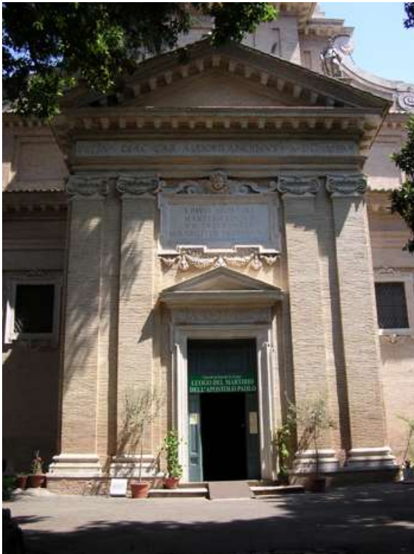
iglesia de San Paolo alle Tre Fontane