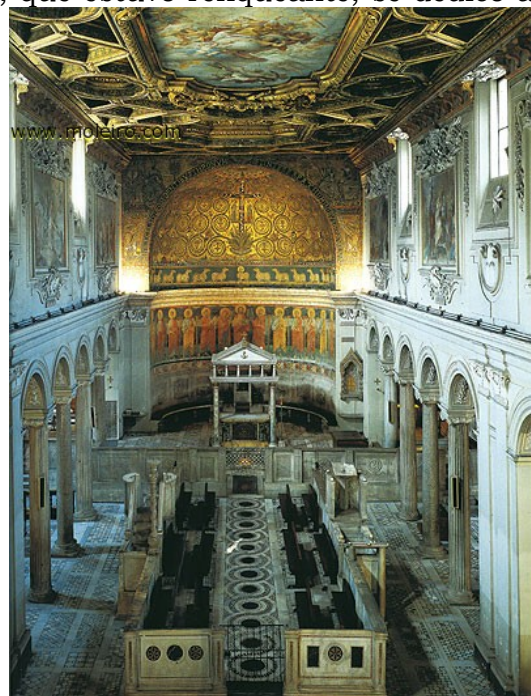
Basilica de San Clemente, Roma

El día 14 pareció más apropiado eludir la celebración de San Valentín, y centrarnos en la de San Cirilo y San Metodio. Un grupo de congregados fuimos a una eucaristía presidida por el cardenal Thomas Spidlik, S. I., con la participación del Pontificio Colegio Nepomuceno. El entorno fue la basílica de San Clemente, donde se conservan las reliquias de San Cirilo (las de San Metodio están en Moravia, República Checa). En esta basílica, que conserva tres niveles (un templo de Mitra, una basílica paleocristiana y otra medieval) nos solidarizamos con nuestros hermanos eslavos en la celebración de estos patronos de Europa.