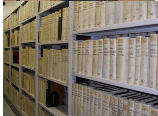
Archivo Romano S. I. Sala de consulta y Fondo