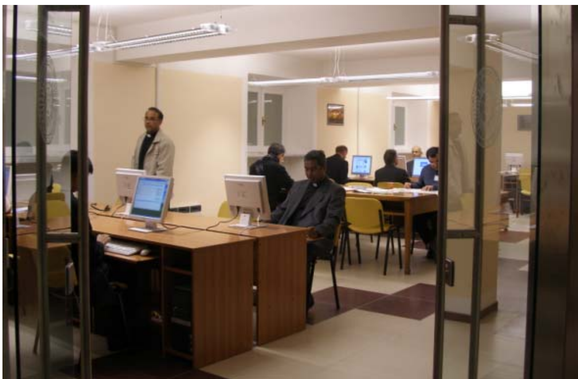
Parte de la Sala Nadal, bajo el aula de la Congregación General, donde antes estaba el fondo de la Biblioteca del Instituto Histórico

El viernes 25 por la tarde y el sábado 26 por la mañana fueron empleados en una sesión plenaria. Se dieron instrucciones para las intervenciones, debiendo comenzar cada una identificando al que habla con su nombre, apellidos, Provincia y número, además de anunciar la lengua que utilizaría. Cada intervención tendría un tiempo máximo de tres minutos con un aviso a los dos minutos, con una campana que había traído como regalo el P. General, que había sido Secretario en la anterior Congregación General y no había podido disponer de una.