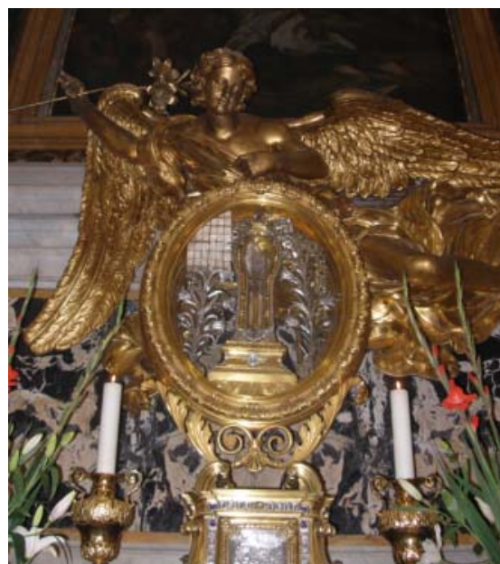
Reliquia de San Francisco Javier, Iglesia del Gesù

Al final de su encuentro, el Padre Nicolás ha explicado a Benedicto XVI la tradición en la que el recién elegido General ha de renovar sus votos delante del Papa. En su momento el Padre Kolvenbach lo hizo por escrito, así que el nuevo Superior General de la Compañía le entregó sus votos en un sobre. El Papa abrió inmediatamente el sobre, leyó su contenido, y dijo al Padre Nicolás: “Esta es una muy buena tradición.”