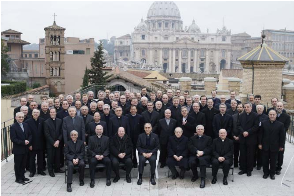
El P. General con los congregados de las asistencias europeas